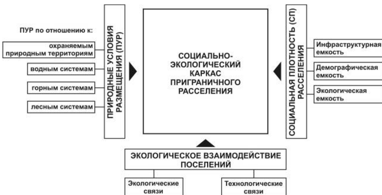
Рисунок 3 - Модель формирования социально-экологического каркаса приграничного расселения

Система Поддержки Планирования представляет собой комплексный инструмент позволяющий, при соблюдении основных градостроительных принципов, производить градостроительное регулирование развития приграничных систем расселения на основе формирования пространственно-экономического и социально-экологического каркасов (Рисунок 4).