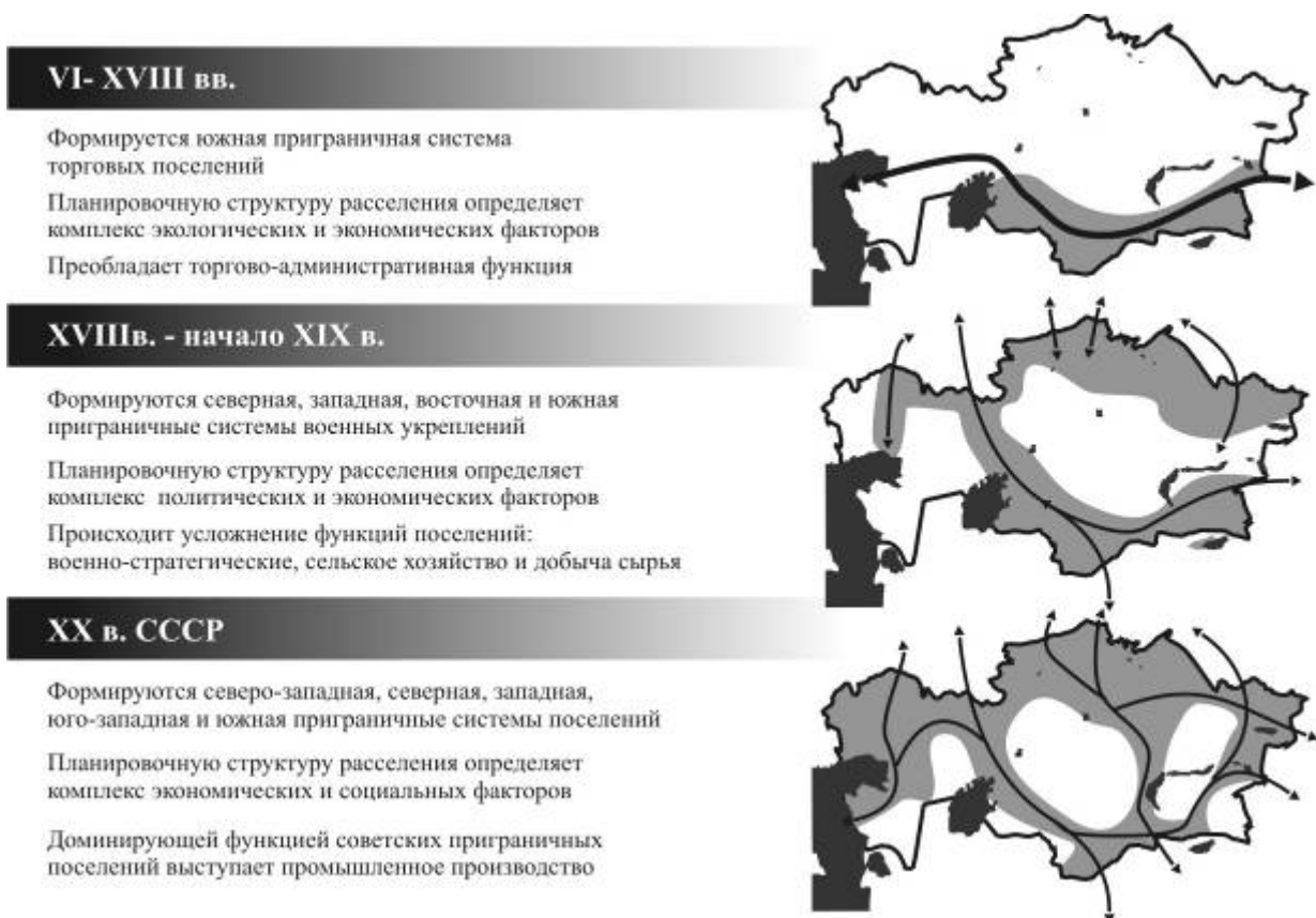
Рисунок 1 - Формирование приграничных поселений Казахстана (VI-XX вв.)

Стратегия развития транзитного потенциала страны путем формирования международных транспортных коридоров на базе сложившихся приграничных систем расселения и строительства новой приграничной инфраструктуры (Международный центр приграничного сотрудничества «Хоргос» и др.) ставит перед современной градостроительной теорией ряд задач, решение которых не возможно без комплексного анализа современных социально-экономических и экологических условий.