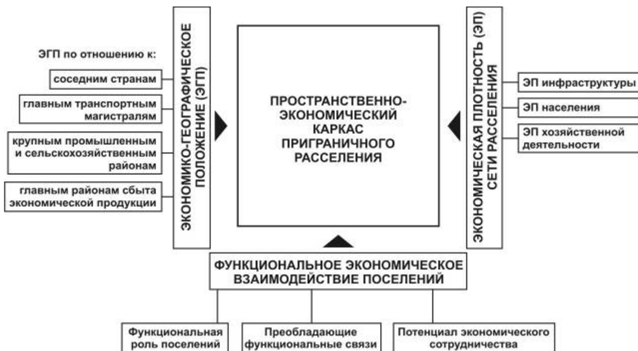
Рисунок 2 - Модель формирования пространственно-экономического каркаса приграничного расселения